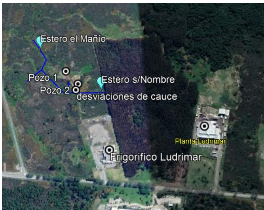
Imagen 1: Ubicación de los pozos y desviaciones de cauce del estero s/nombre

En relación a la superficie de los pozos, el pozo 1 tuvo una superficie de 1250 m 3 y el pozo 2 una superficie de 150 m 3