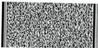
Timbre Electrónico SII

MONTO NETO $ 594.000 I.V.A. 19% $ 112.860 IMPUESTO ADICIONAL $ 0 TOTAL $ 706.860