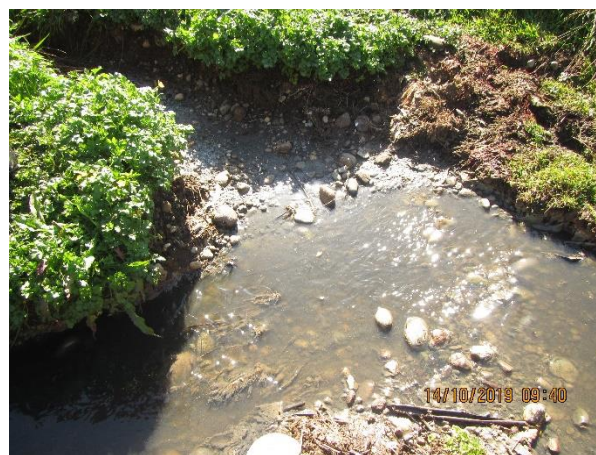
Imagen 4-5: Fotografía actual pozos rellenados